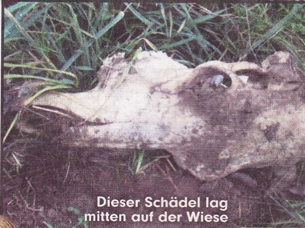
Dieser Schädel lag mitten auf der Wiese

Der Landwirt, der den Hof vor 12 Jahren von seinem Vater übernommen hat, besitzt etwa 260 Tiere. Seit Jahren steht der Hof unter Beobachtung, u.a. weil es Fälle von Paratuberkulose gab. Dabei handelt