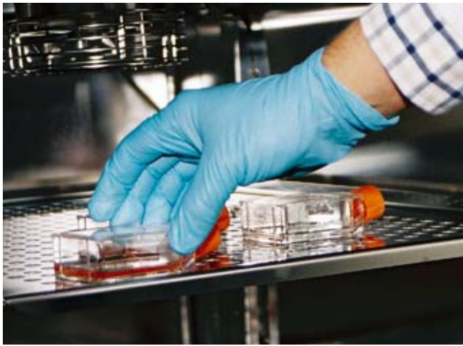
Die Zellen werden im Brutschrank kultiviert.