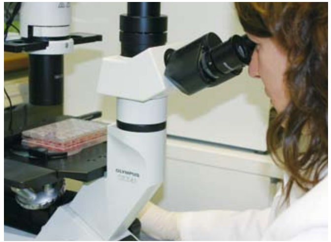
Nach Zugabe einer Testsubstanz wird das Wachstum der Zellen unter dem Mikroskop beurteilt.