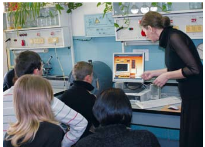
Mit modernen Computersimulationen können Organfunktionen anschaulich dargestellt werden.

Mit interaktiven Computerprogrammen lassen sich die klassischen Froschversuche sowie zahlreiche andere Experimente und sogar Sektionen virtuell am Bildschirm nachvollziehen. Die Physiologie kann mit harmlosen Selbstversuchen am eigenen Körper erfahren werden. Mit myographischen Verfahren lassen sich beispielsweise, anstelle eines Froschmuskels, Nerv- und Muskelströme am Daumen eines Studenten bestimmen. Operationsmodelle aus Kunststoff eignen sich zur Übung chirurgischer Fingerfertigkeiten. Auch für das Erlernen der Anatomie der Tiere ist es absolut nicht notwendig extra Tiere zu töten. Aus medizinischen Gründen eingeschlaferte oder tot aufgefundene Tiere können zu diesem Zweck verwendet