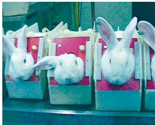
Statt in Kästen fixierten Kaninchen Infusionslösungen zu injizieren kann ein Test mit menschlichem Blut verwendet werden, um Fieber auslösende Stoffe aufzuspüren.

Bei allen Infusionslösungen, Impfstoffen und anderen Substanzen, die in den menschlichen Körper gespritzt werden, muss untersucht werden, ob sie Stoffe enthalten,