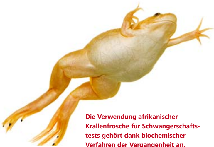
Die Verwendung afrikanischer Krallenfrösche für Schwangerschaftstests gehört dank biochemischer Verfahren der Vergangenheit an.

leukin-1 \beta aus, wenn sie mit fieberauslösenden Bakterienbestandteilen in Berührung kommen. Die Menge des Interleukin-1 \beta wird vollautomatisch mit Hilfe von Farbreaktionen gemessen. Man erhält sehr genaue und wiederholbare Ergebnisse, die für den Menschen direkt aussagekräftig sind. Dieser Vollblut-Pyrogentest wurde schon Anfang 1990 an der Universität Konstanz entwickelt. Trotz hervorragender Ergebnisse bei verschiedenen Validierungsstudien, wird er bislang nur zögerlich eingesetzt. Der Test soll in das Europäische Arzneibuch aufgenommen werden.